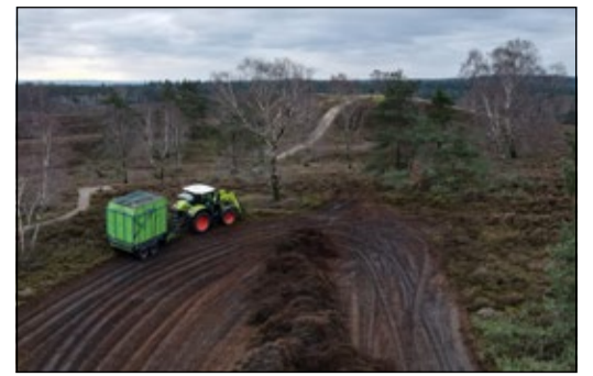
Naturschutz heißt nicht Stillstand. Viele Lebensräume brauchen aktive Pflege.