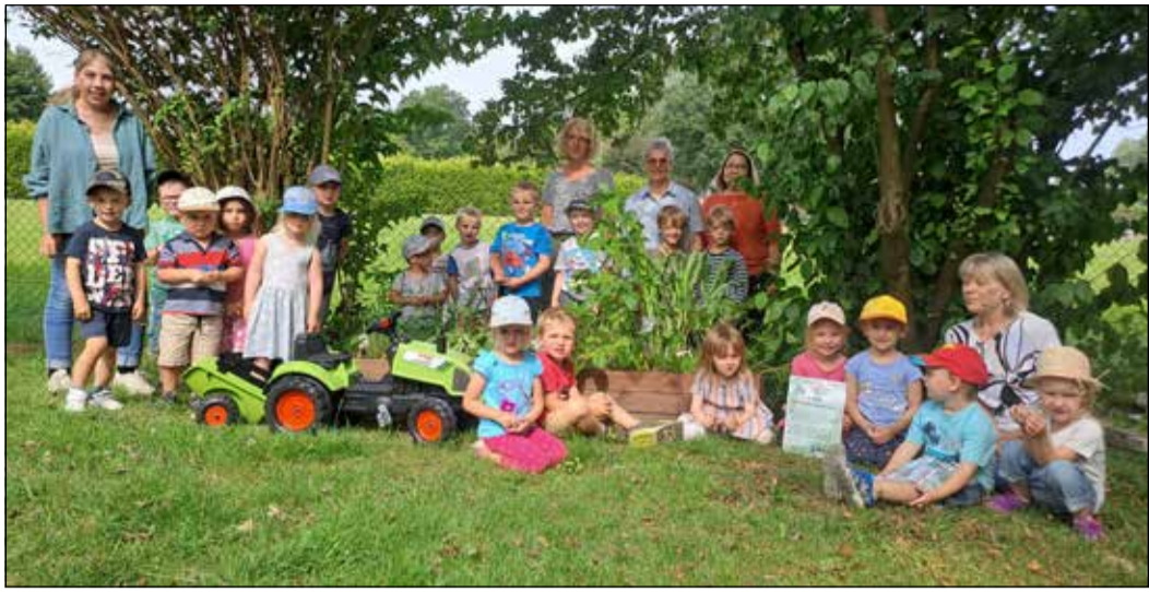
Das Foto zeigt die Gewinner aus 2024. Der Kindergarten Stellichte hat sich sehr über den gewonnenen Trecker gefreut.