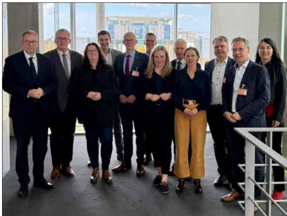
Vertreter der Landkreise Celle, Harburg, Heidekreis und Uelzen sprachen in Berlin mit Bundestagsabgeordneten über das Thema Alpha E und die von der Deutschen Bahn forcierte Neubautrasse.