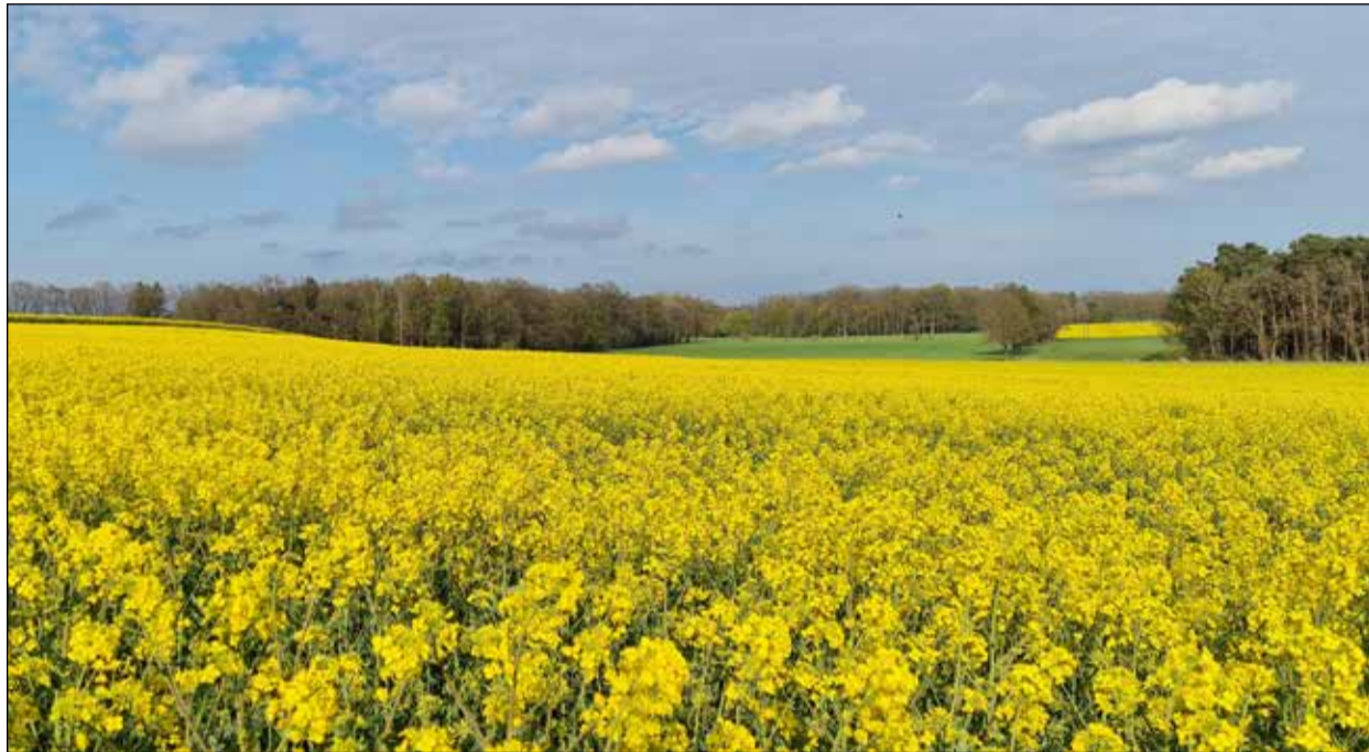
Blick in die frühlingshafte Feldmark vom Aussichtspunkt „An der Bank“ in Dorfmark/Mengebostel.

Auf den regionalen Wochenmärkten wurde der Spargel bei Reaktionschluss für 12 bis 13 Euro je Kilogramm angeboten. Der Preis bewegt sich damit auf Vorjahresniveau. Die Vereinigung der Spargel- und Beerenanbauer schreibt: „Die Einsparmöglichkeiten sind ausgereizt, da geht erst wieder etwas, wenn der Spargel durch Roboter oder Vollerner geerntet wird“.