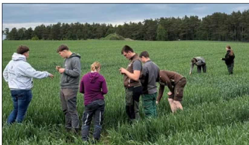
Fragen zur Bestandsführung wurden beim Feldtag intensiv diskutiert.

Beim jüngsten Feldtag standen die Kulturen Kartoffeln, Mais und Getreide im Mittelpunkt des Interesses.