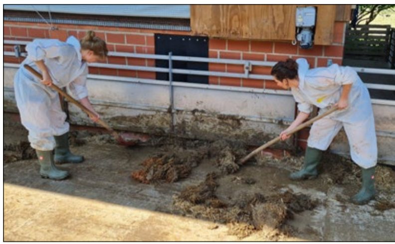
Bereits im vergangenen Jahr war die Familie Becker in Reddingen Gastgeber als „Hof mit Zukunft“.