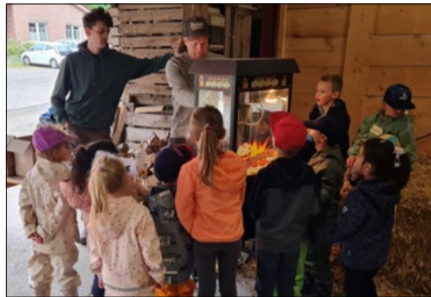
Kaum zu glauben – aber aus Maiskörnern wird Popcorn.