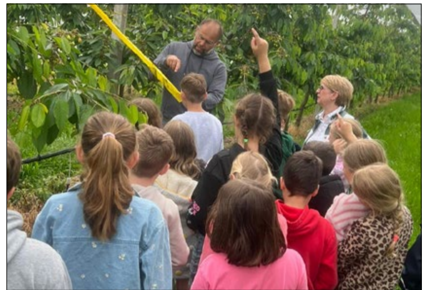
Am 4. Juni veranstaltete die Grundschule Drage wieder einen Altionstag zum Thema Landwirtschaft auf dem Obsthof Marben in der Elbmarsch. Rund 60 Kinder aus den dritten Klassen verbrachten einen informativen Tag zwischen Obstbäumen und Aktionstischen mit thematischen Aufgaben.