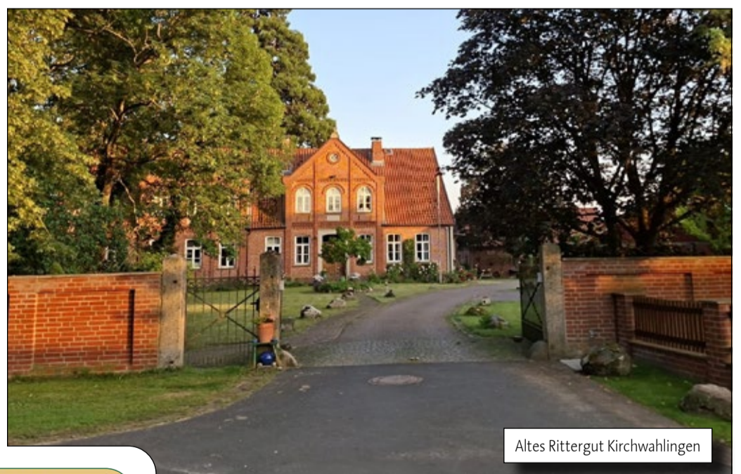
Altes Rittergut Kirchwahlen

bereits in der bevorstehenden Saison betriebsbereit sein soll. „Der Bau ist fast fertig – alles läuft nach Plan – die ersten Kartoffeln werden für Probeläufe schon bearbeitet“, sagte Baden. Die Tour führte in diesem Jahr durch die Gemarkungen Brochdorf und Delmsen. Zum Abschluss gab es Leckeres vom Grill.