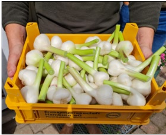
Zum Verkauf aufbereitete Knoblauch-Zwiebeln.

Sprötze (ccp). Vorerntegespräche mit Vertretern der regionalen Presse folgen seit Jahren einem zuverlässig wiederkehrenden Verlauf: Nach der Einführung in die Besonderheiten des laufenden Erntejahres beziehen Kreislandwirt, Landvolk-Chef, Wirtschaftsberater und Betriebsleiter Position in einem Getreidefeld und vermitteln für ein aussagefähiges Pressefoto den Eindruck einer fachkundigen Bestandsanalyse. In der Bildunterschrift ist dann zu lesen, wann mit dem Erntebeginn zu rechnen ist und wie die Ertragsaussichten ausfallen.