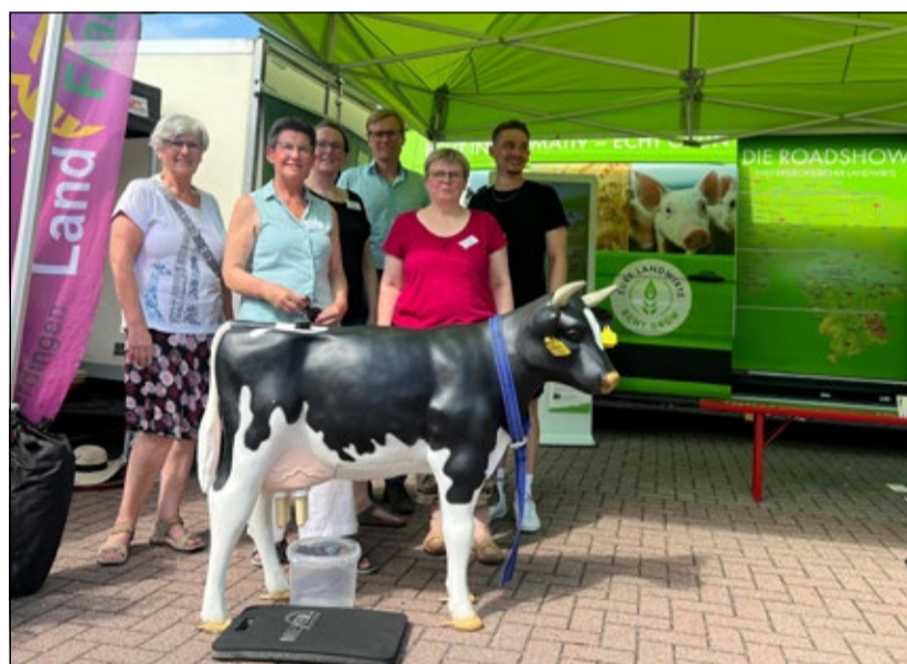
Roadshow-Mobil in Schneverdingen.

einer tollen Kooperation mit den Landfrauen wurde auch die Präsentation auf dem Stadtfest in Schneverdingen zum Erfolg. An beiden Veranstaltungen wurde viel gesprochen und diskutiert, und kleine sowie große Besucherinnen und Besucher hatten die Möglichkeit, ihr Wissen rund um die Landwirtschaft zu testen und tolle Preise am Glücksrad zu gewinnen.